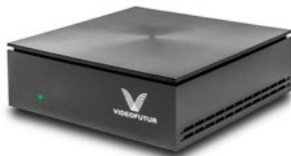
Box TV VIDEOFUTUR.

Le branchement du routeur (boîtier blanc) et de la box TV (boîtier noir), doit être réalisé par vos soins. Pour vous aider à connecter votre kit merci de vous reporter au guide d'installation disponible dans votre email de bienvenue ou bien directement dans la section « infos techniques » de notre site internet.