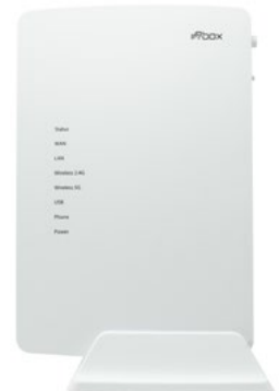
Exemples de routeur VIDEOFUTUR. Vous recevez l'un ou l'autre de ces routeurs dans votre kit de connexion.