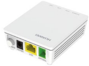
Exemple d'ONT. Photo non contractuelle.

Merci de laisser l'ONT sous tension pour permettre l'activation de vos services. Les délais d'activation peuvent atteindre 5 jours ouvrés (10 jours pour Covage). Passé ce délai, merci de prendre contact avec le service client si l'activation n'a pas eu lieu.