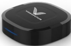
Box TV VIDEOFUTUR.

Le branchement du routeur (boîtier blanc) et de la box TV (boîtier noir), doit être réalisé par vos soins. Pour vous aider à connecter votre kit merci de vous reporter au guide d'installation disponible dans votre email de bienvenue ou bien directement dans la section « infos techniques » de notre site internet.